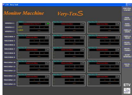
Servidor Very-TexS para monitoreo verificadoras e interface para gestión

ETV Elettronica Tessile Varese Srl - via Campo dei Fiori 37 • 21056 Induno Olona (VA) Italy Tel. +39 0332 203 037 • Fax +39 0332 202 924 – etv@etvsrl.com • www.etvsrl.com